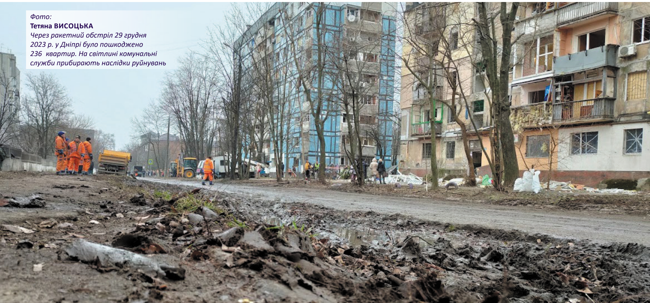
Через ракетний обстріл 29 грудня 2023 р. у Дніпрі було пошкоджено 236 квартир. На світліні комунальні служби прибирають наслідки руйнувань