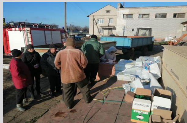
Фото 3-4. Надання допомоги постраждалим через російські обстріли у Кочубеївській територіальній громаді від Гуманітарного центру "Проліска" від УВКБ ООН.