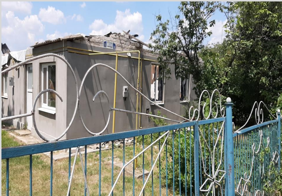
Фото 2. Зруйнований внаслідок бойових дій російських військ житловий будинок у с. Орлове, Кочубеївська громада.

Зважаючи на відсутність індикаторів функціонування місцевої програми у громаді, Херсонська приймальня УГСПЛ направила повторний запит із проханням пояснити ситуацію. Однак станом на момент підготовки цього аналізу відповіді не надійшло – це свідчить про формальний підхід адміністрації громади до реалізації місцевої програми відновлення житла. Тому питання наявності такої програми тільки на папері залишається відкритим.