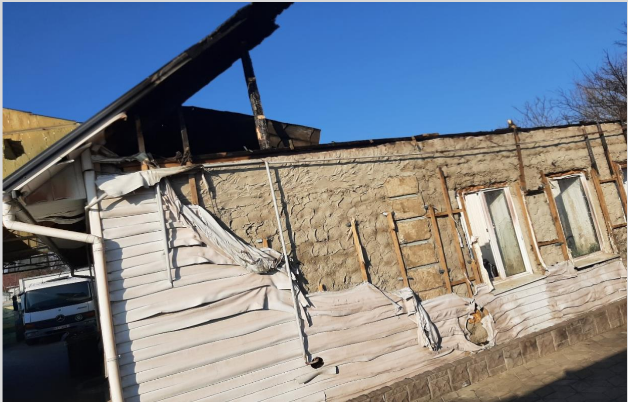
Фото 10. Зруйнований внаслідок бойових дій російських військ житловий будинок у с. Чернобаївка, Чернобаївська громада.

Попри це у вільному доступі не виявлено вичерпної інформації про весь обсяг наданих компенсацій з використанням електронної публічної послуги «eВідновлення», кількості рішень комісії про відмову в наданні компенсації та їх причини, звітів про впровадження місцевих та гуманітарних програм ліквідації наслідків збройної агресії РФ на території громади, результатів їх упровадження (кількість відремонтованих будинків чи профінансованих з метою ремонту й відновлення).