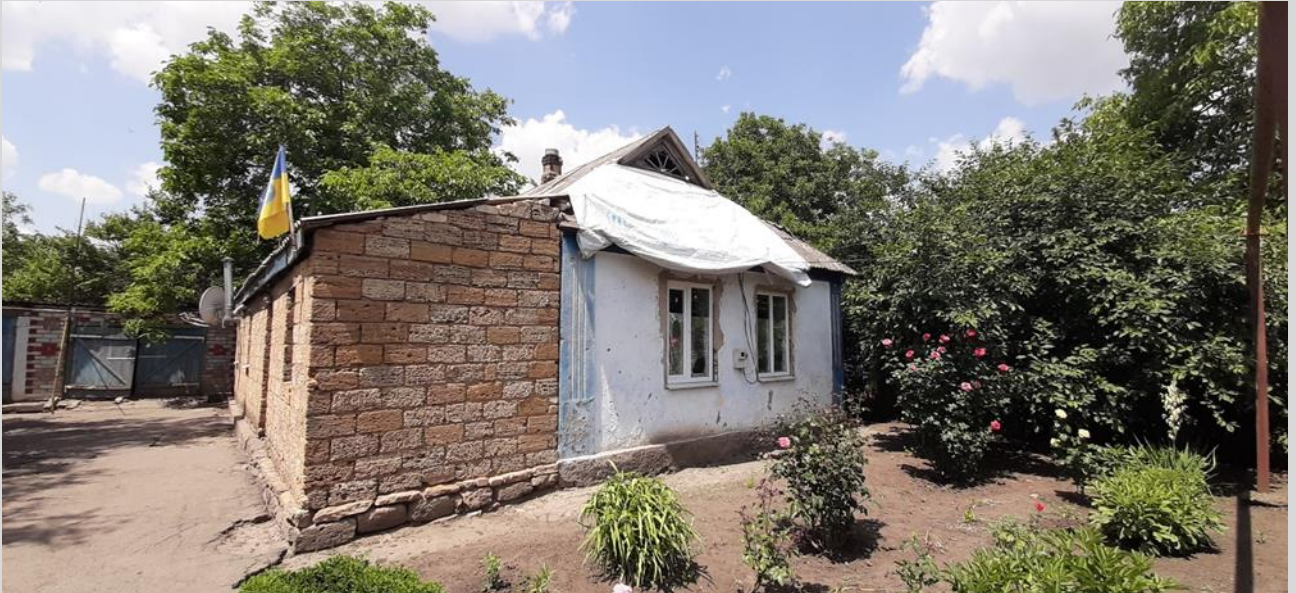
Фото 6. Зруйнований внаслідок бойових дій російських військ житловий будинок у с. Кочубеївка, Кочубеївська громада.

Важливою частиною роботи місцевої влади, а також інструментом доступу до інформації та підвищення рівня довіри громадян до органів влади є публічне звітування .