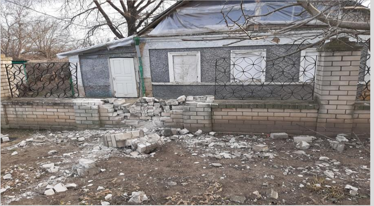
Фото 7. Зруйнований внаслідок бойових дій російських військ житловий будинок у с. Чернобаївка, Чернобаївська громада.