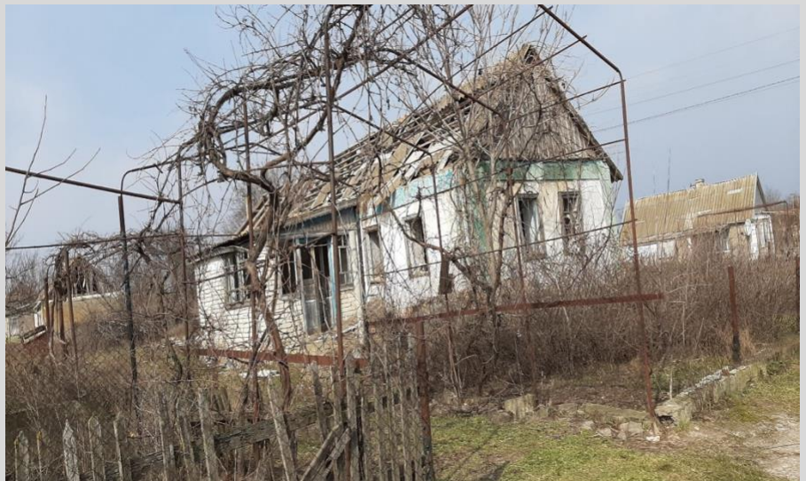
Фото 1. Зруйнований російськими військами житловий будинок у с. Заградівка, Кочубеївська громада.

У ході аналізу виявлено, що громада обробила половину заяв про надання компенсації, інформації про розгляд решти не надала. Це свідчить про нагальність потреби у відновленні житла, – люди очікують на розгляд своїх заяв, а також про необхідність активізації діяльності комісії з розгляду питань щодо надання компенсації за знищені об'єкти нерухомого майна.