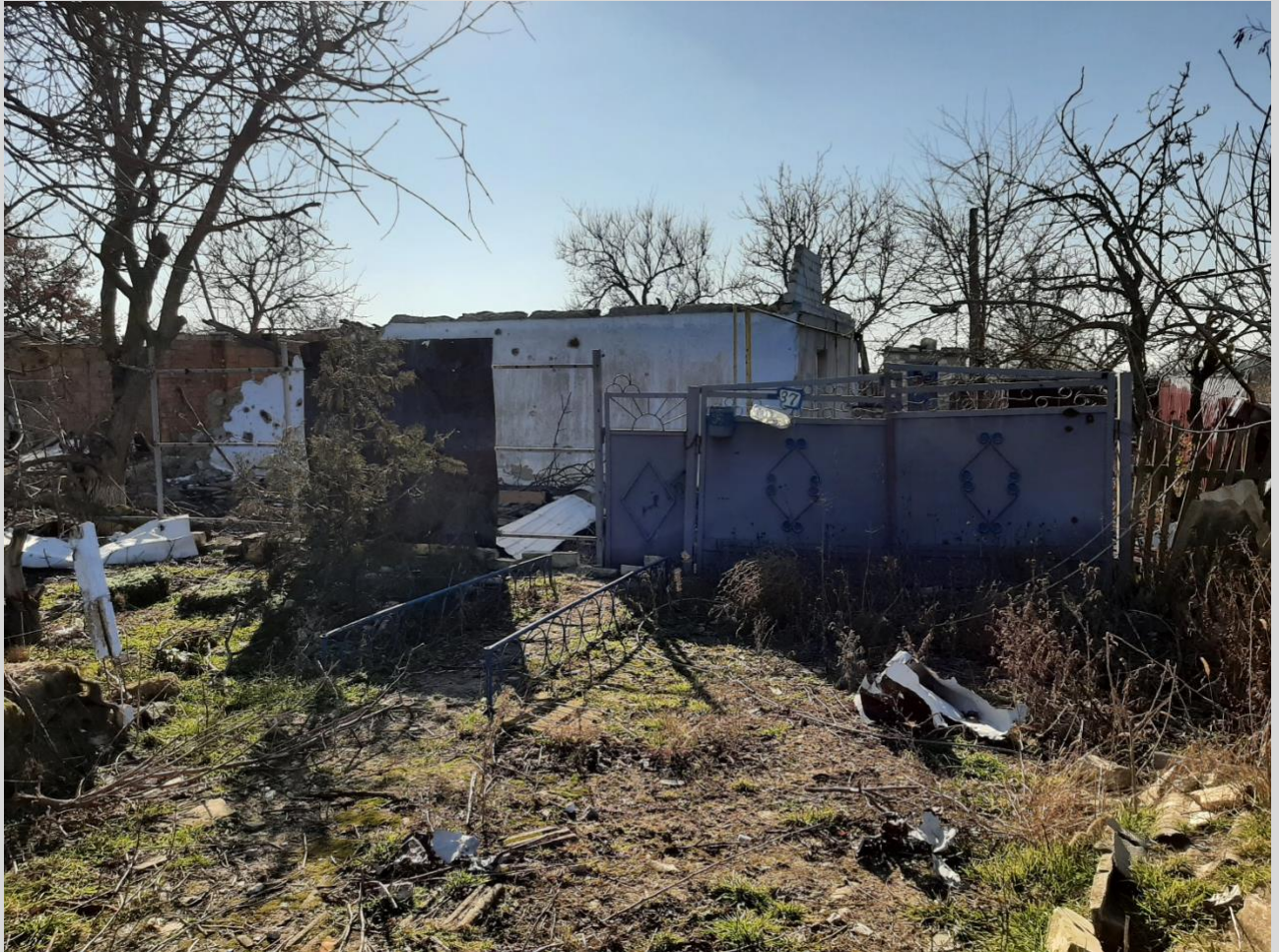
Фото 8. Зруйнований внаслідок бойових дій російських військ житловий будинок у с. Посад-Покровське, Чорнобаївська громада.