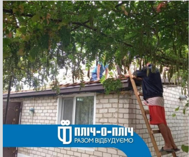
Фото 8-9. Проведення ремонтних робіт у постраждалій внаслідок російських обстрілів Чорнобаївській територіальній громаді будівельниками з Одещини в межах програми «Пліч-о-пліч».

Окрім урядової програми «Пліч-о-пліч», у відбудові громади допомагають закордонні організації – надають фінанси для придбання будівельних матеріалів для будинків, які мають не тотальні пошкодження.