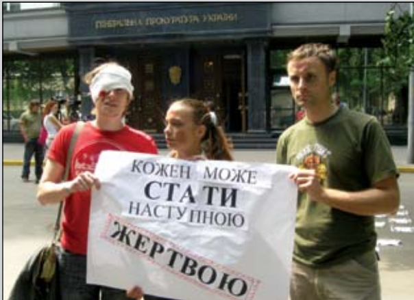
На фото учасники акції «Проти катувань»

26-го червня — Міжнародний день на підтримку жертв катувань. У цей день Українська Гельсінська спілка з прав людини, другий рік поспіль відвідала Генеральну прокуратуру.