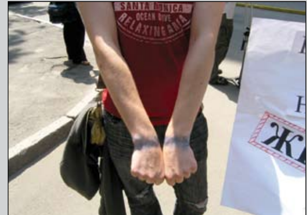
На фото учасники акції «Проти катувань»

Відео з акції можна подивитися тут: http://www.youtube.com/ugspl#p/a/f/2/11LUA3VoTso