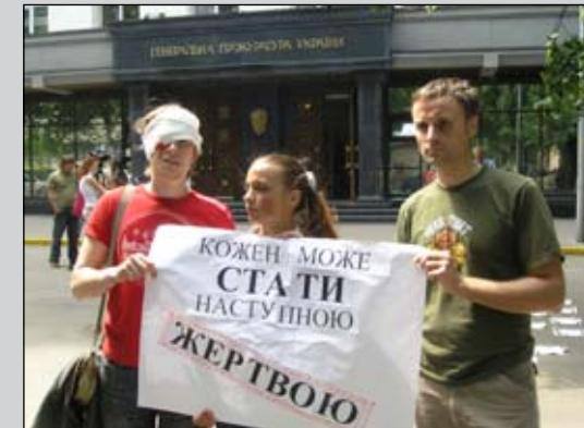
Акція «Проти катувань»