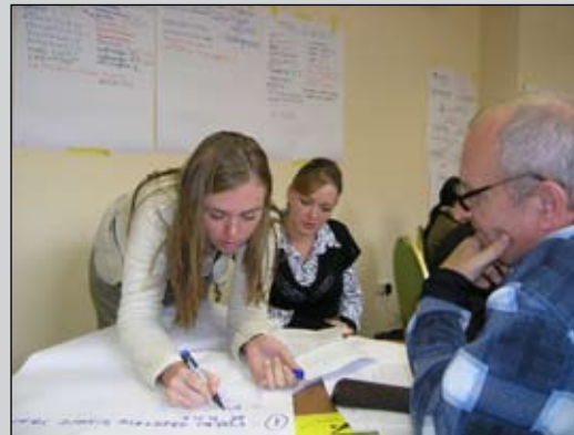
Учасники тренінгу для журналістів виконують завдання