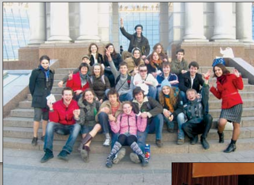
Правозахисний квест «В пошуках свободи»