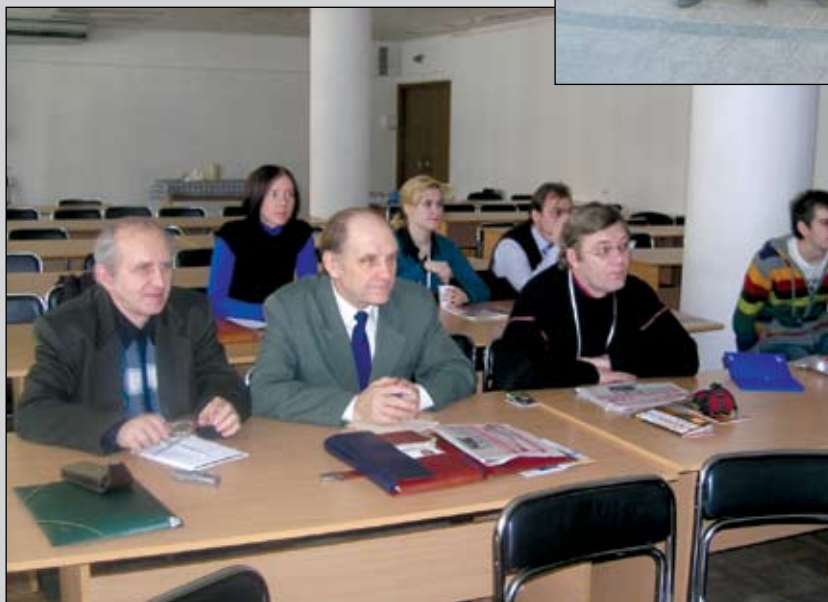
Семінар з протидії дискримінації в рамках Docudays.Ua