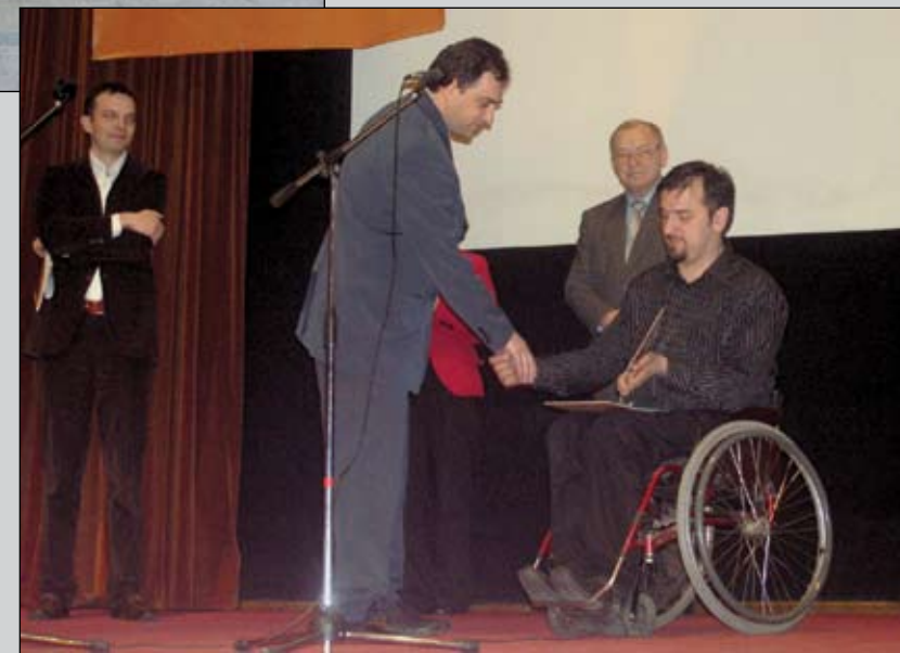
Вручення нагороди лауреатам Docudays.Ua