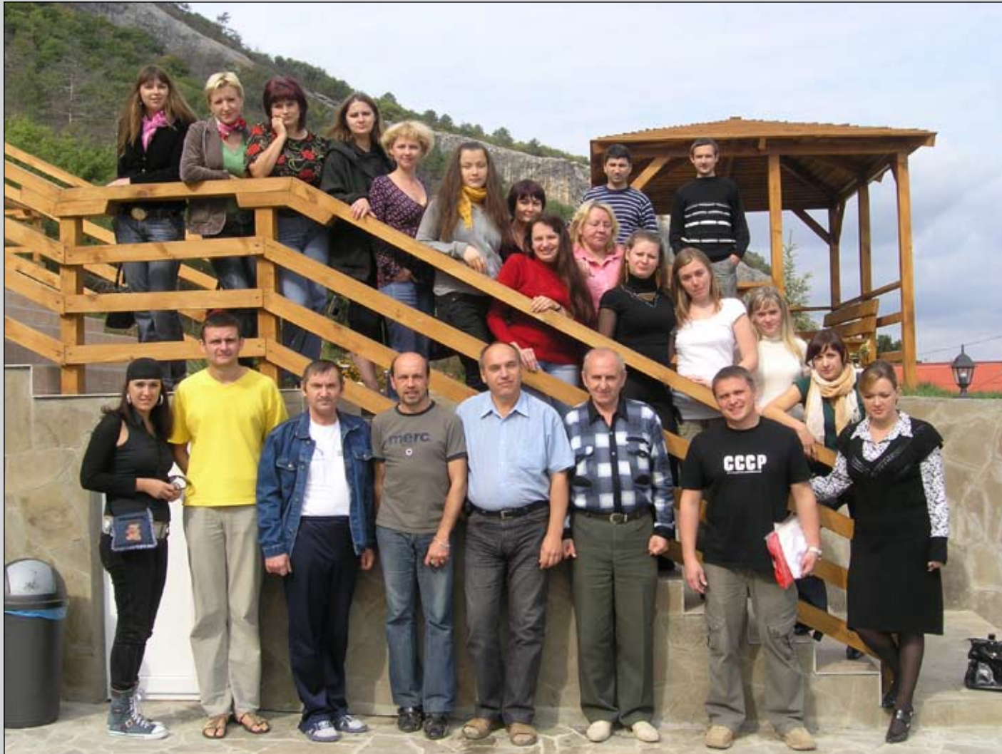
На фото: випускники курсу «Права людини для журналістів»

Однією з найбільших освітніх правозахисних програм в Україні є проект «Розуміємо права людини» .