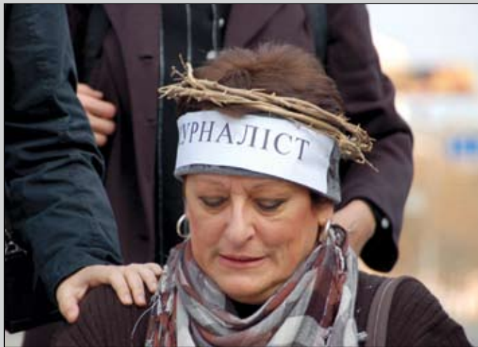
На фото: журналіст на колінах і в терновому вінку — наочна ілюстрація ситуації зі свободою слова в Росії

12 жовтня біля посольства Російської Федерації в Україні відбулася акція протесту проти переслідування журналіста і правозахисника Олександра Подрабінека та свободи слова у Росії, організована Конгресом національних громад України, Українською Гельсінською спілкою з прав людини, Кримськотатарським молодіжним центром, Асоціацією єврейських організацій та общин (Ваадам) України. В посольство було передано звернення учасників акції протесту.