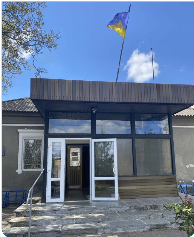
На фото: будівля Біленьківської сільської рада