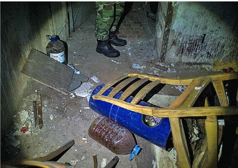
Приміщення Северодонецького УБОЗ, «подвал»

«Была отдельная группа, их называли ОПГ. Это бригада строителей, которых сдал их начальник, чтобы не платить зарплату. А начальник приехал в ГИАП с жалобой на то, что у него бандиты вымогают деньги. Они со своим начальником встречаются, разговаривают. На них набрасываются с выстрелами, вьют. Избивают, забирают в машину и в подвал».