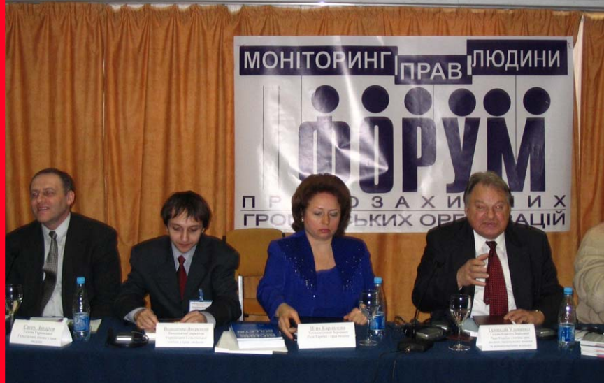
Другий міжнародний форум правозахисних організацій «Моніторинг прав людини»

група), Харківській та Луганській областях (по 15 груп), Херсонській та Миколаївській областях (по 10 груп), Вінницькій, Дніпропетровській (Кривий Ріг), Сумській та Чернігівській областях (по 5 груп). Проект реалізовували: Харківська правозахисна група, Луганське обласне відділення Комітету виборців України, Севастопольська правозахисна група, Херсонська міська асоціація журналістів «Південь», Центр досліджень регіональної політики (м. Суми), Чернігівський громадський комітет захисту прав людини, Луганське обласне відділення Комітету виборців України, Вінницька правозахисна група, Інститут соціальних досліджень (м. Сімферополь), Херсонський обласний фонд «Милосердя та здоров'я», Херсонська обласна