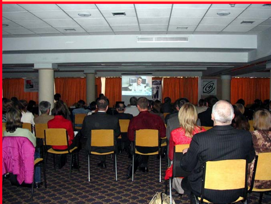
Другий міжнародний форум правозахисних організацій «Моніторинг прав людини»

11 – 12 квітня 2005 року — Другий міжнародний форум неурядових правозахисних організацій «Моніторинг прав людини та основних свобод в Україні», на якому був представлений відео звіт про порушення прав людини під час виборів (спільно з фундацією «Чинність закону») та річний звіт щодо дотримання прав людини в Україні за 2004 рік. У роботі Форуму взяли участь понад 150 представників правозахисних організацій з усіх регіонів України, міжнародних правозахисних організацій (Human Rights Watch, Міжнародна амністія, Міжнародна Гельсінська Федерація за права людини), Гельсінських комітетів Росії, Білорусі та Молдови, міжнародні консультанти і представники: донорських організацій, дипломатичного корпусу, партнерських структур із країн Центральної і Східної Європи, а також іноземні громадські діячі, гості й журналісти.