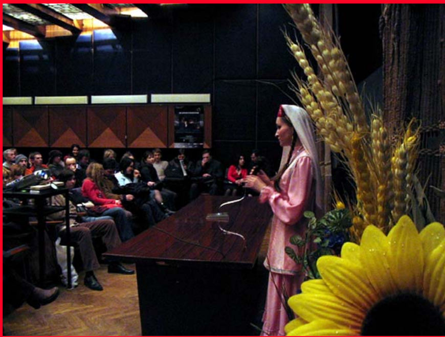
Виступ гостей з Росії під час міжнародного фестивалю Дні документального кіно про права людини