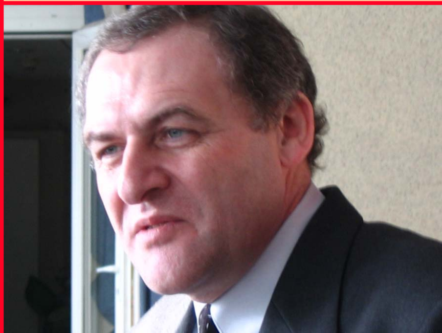
Євген Захаров Голова правління Української Гельсінської спілки з прав людини, співголова Харківської правозахисної групи

До Наглядової Ради Спілки увійшли відомі діячі правозахисного руху 60-х — 80-х років: Зиновій Антонюк, Микола Горбаль, Йосип Зісельс, Василь Лісовий, Василь Овсієнко, Євген Пронюк та Євген Сверстюк.