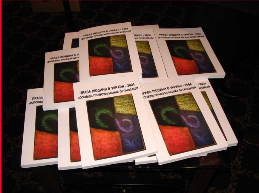
Друковані звіти «Права людини в Україні 2004»

Вперше неурядовими громадськими організаціями України було підготовлено системний комплексний звіт, що складається з 21 розділу про порушення прав людини в Україні в 2004 році. Звіт — не просто констатація фактів, кожний розділ закінчується конкретними рекомендаціями для уряду щодо покращення ситуації з тими чи іншими людськими правами та свободами. Звіт був виданий двома мовами, українською та англійською — текст можна взяти на РУПОРі.