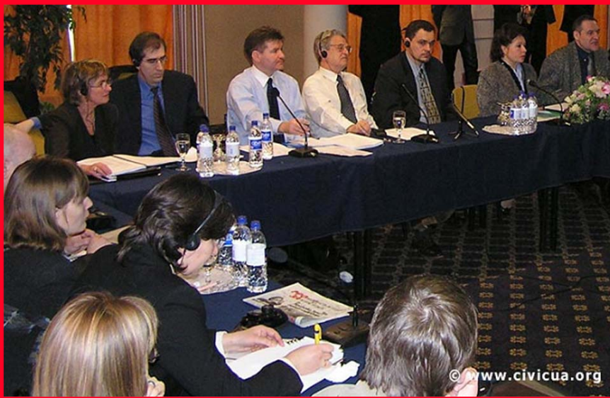
Перший в Україні форум громадських правозахисних організацій «Права людини на виборах»

почали сприяти практичному виконанню гуманітарних статей Заключного акту Гельсінської наради з безпеки та співробітництва в Європі (ОБСЄ) 1975 року. Цим документом було підкреслено універсальність прав людини, тому вони не можуть бути виключно внутрішньою справою країни. У 1976 році була створена Українська гелсінська група сприяння виконанню гелсінських угод (УГГ), абсолютна більшість членів якої була піддана репресіям, проте рух не припинив своє існування. У 1988 році УГГ була перетворена на Українську Гельсінську Спілку (УГС), котра проте вже мала виразно політичні, а не правозахисні функції. Із складу УГС вийшли засновники усіх національно-демократичних партій, а більшість членів УГС заснували у 1990 році Українську Республіканську Партію. Тому вона була перетворена 1990 році на Українську Республіканську Партію. Щоби продовжити традицію неполітичного правозахисного руху в Україні, 16 червня того ж року з ініціативи Оксани Мешко було створено Український комітет «Гельсінкі-90», який так і залишився підрозділом Всеукраїнського товариства політв'язнів та репресованих.