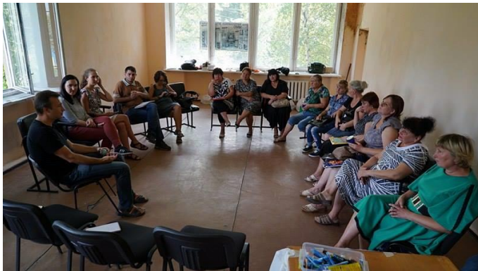
Семінар у Золотому Луганської області

В рамках ініціативи були проведені дводенні тренінги у населених пунктах Щастя, Золоте та Станиця Луганська, впродовж яких учасники змогли підвищити свої знання в області прав людини, демократичних цінностей, верховенства права, основ соціального та інституційного самоврядування.